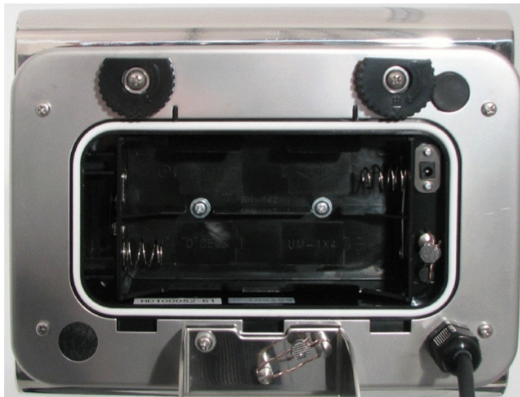
Typical seal / Scellé typique