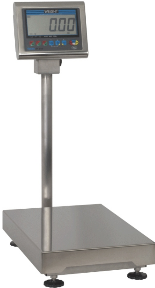
Typical models DP-6700-60, DP-6700-150 and DP-6700-300 / Modèles DP-6700-60, DP-6700-150 et DP-6700-300 typiques