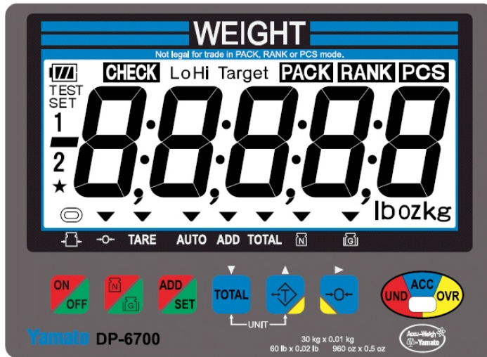
Typical display and keypad / Affichage et touches typiques