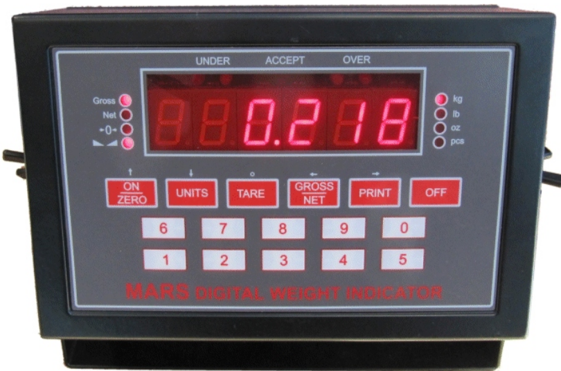
Typical MSx-3yz model / Modèle MSx-3yz typique