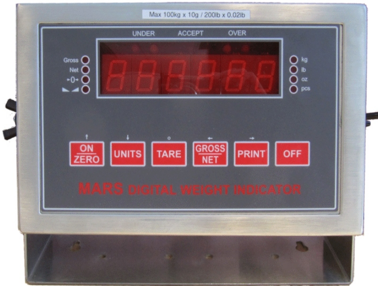
Typical MSx-2yz model / Modèle MSx-2yz typique