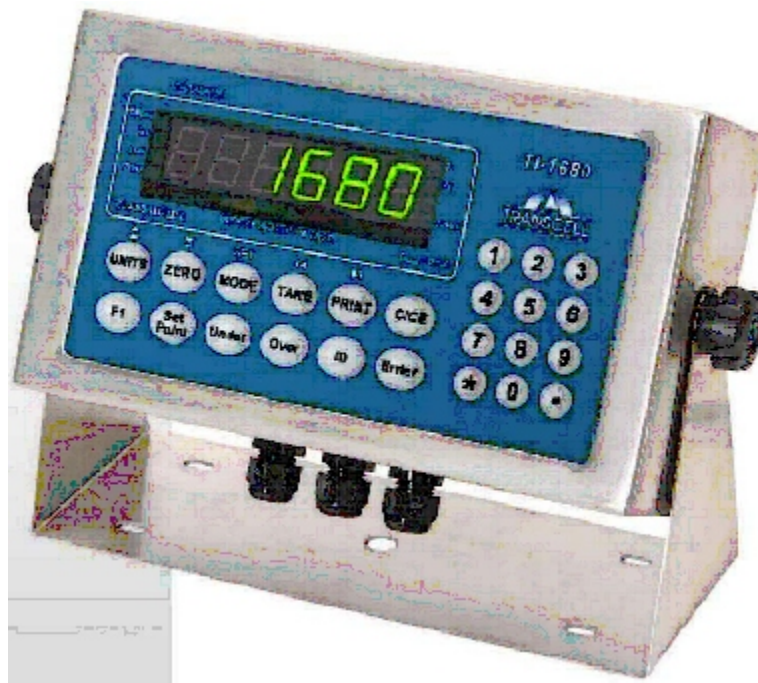
Typical TI-1680 / TI-1680 typique