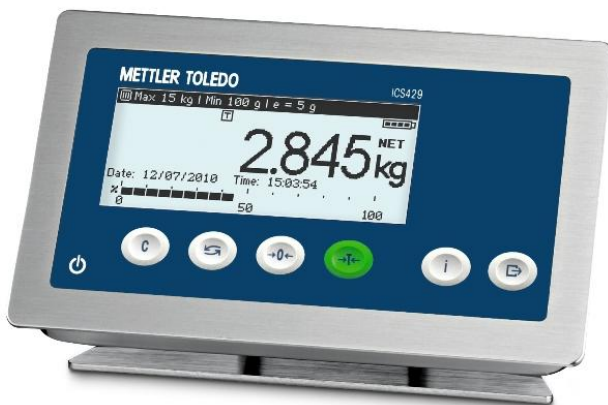
Typical Model ICS429-1 / Modèle typique ICS429-1