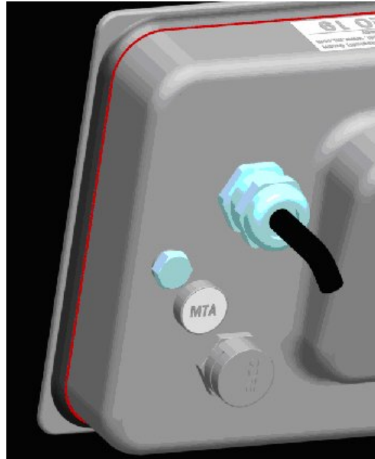
Typical paper seal for all models / Scellé papier typique pour tous les modèles