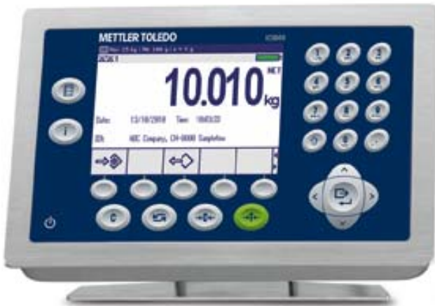
Typical Model ICS669-1 / Modèle typique ICS669-1