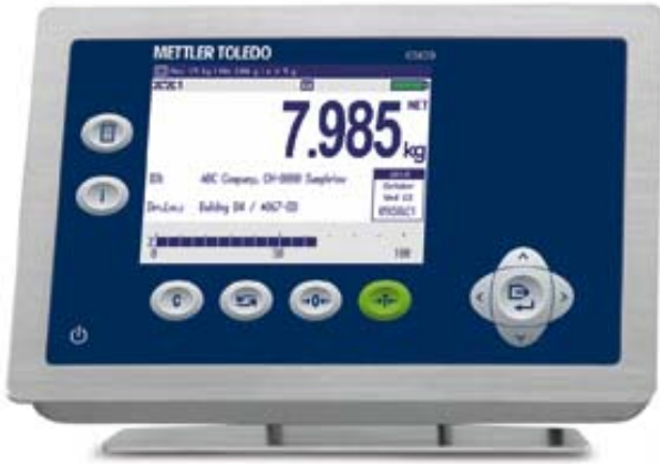
Typical Model ICS629-1 / Modèle typique ICS629-1