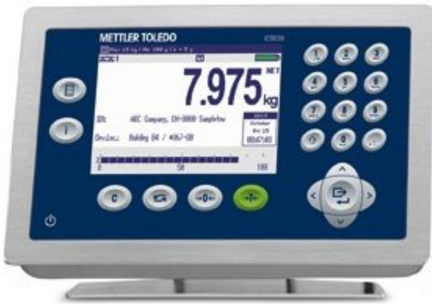
Typical Model ICS639-1 / Modèle typique ICS639-1