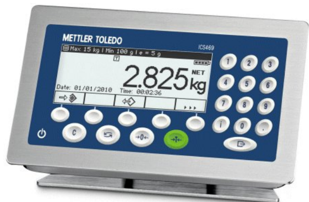
Typical Models ICS469-1 and ICS466x / Modèles typiques ICS469-1 et ICS466x