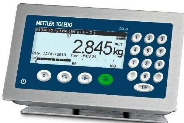
Typical Model ICS439-1 / Modèle typique ICS439-1