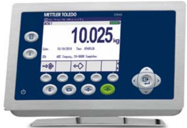
Typical Model ICS649-1 / Modèle typique ICS649-1