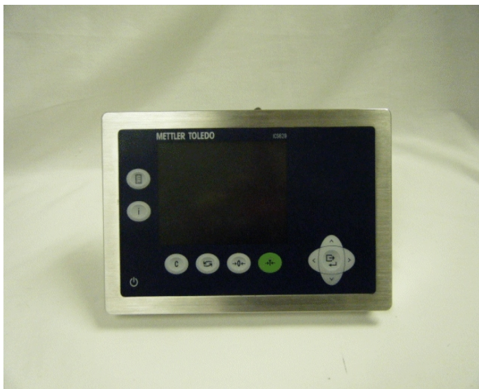
Typical ICS629-1 model / Modèle ICS629-1 typique