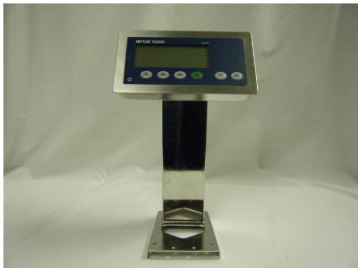
Typical ICS429-1 model mounted on column / Modèle ICS429-1 typique monté sur colonne