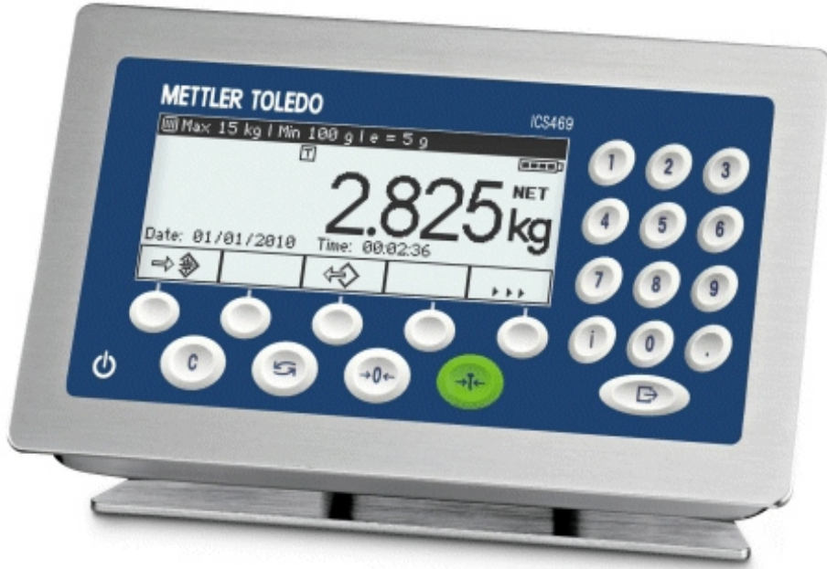
Typical ICS469-1 model / Modèle ICS469-1 typique