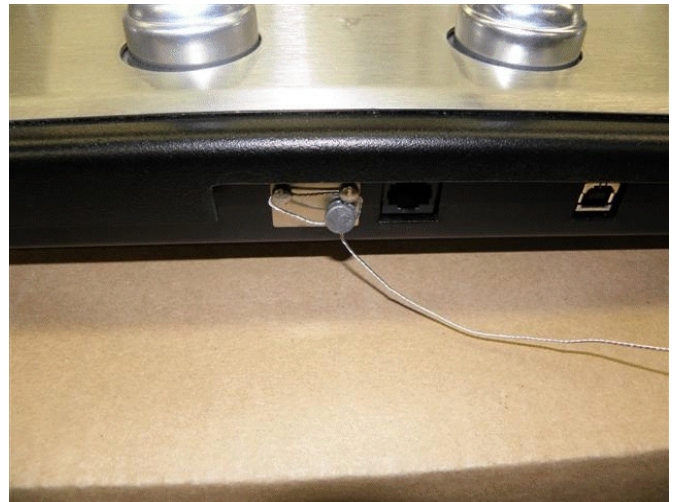
Typical seal / Scellé typique