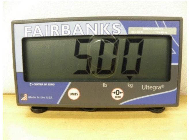
Typical remote display / Afficheur à distance typique