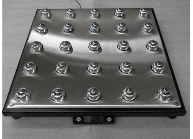
Typical model SCB-R9050-*** with roller ball platter / Modèle SCB-R9050-*** typique avec plateau à billes