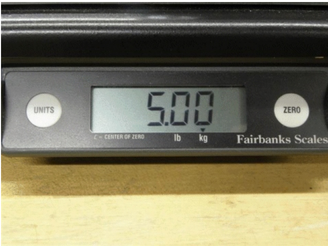
Typical integrated display / Afficheur intégré typique