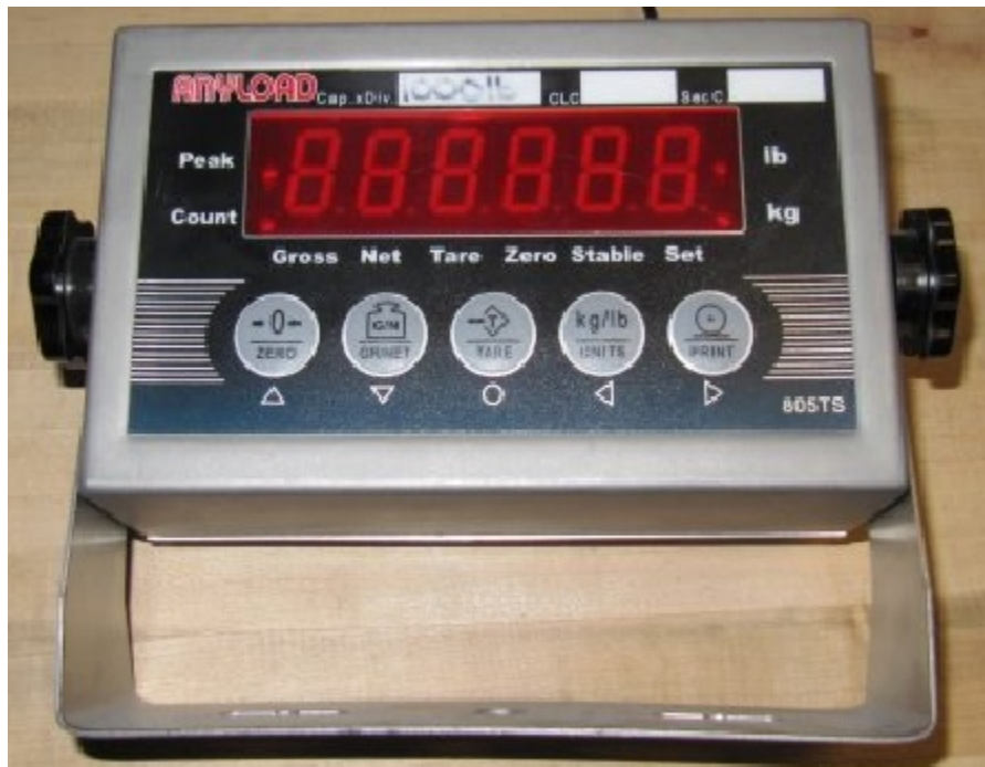
Typical model 805TS / Modèle 805TS typique