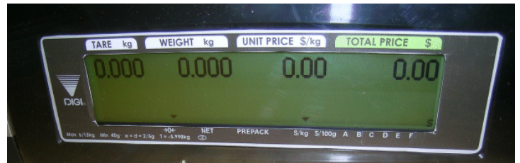
Typical customers' display for models SM-5400## Audit Trail and SM-5000H Audit Trail / Affichage destiné aux clients typique des modèles SM-5400## Audit Trail et SM-5000H Audit Trail