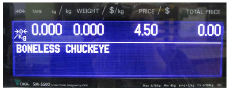
Typical customers' display for models SM-5500## Audit Trail / Affichage destiné aux clients typique des modèles SM-5500## Audit Trail