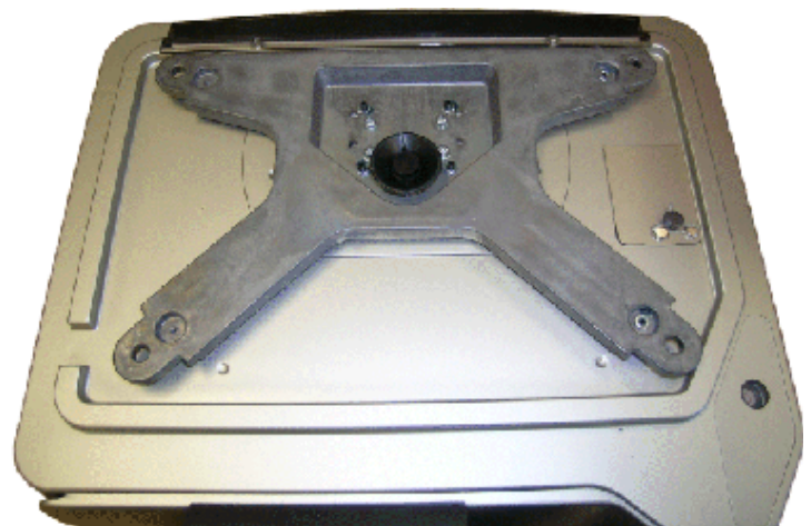
Typical subplatter of all approved models except for model SM-5000H Audit Trail / Sous-plateau typique de tous les modèles approuvés à l'exception du modèle SM-5000H Audit Trail