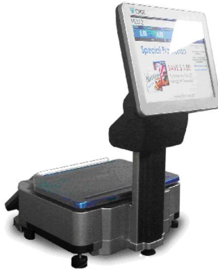
Typical models SM-5500P Plus Audit Trail and SM-5600P Plus Audit Trail / Modèles SM-5500P Plus Audit Trail et SM-5600P Plus Audit trail typiques