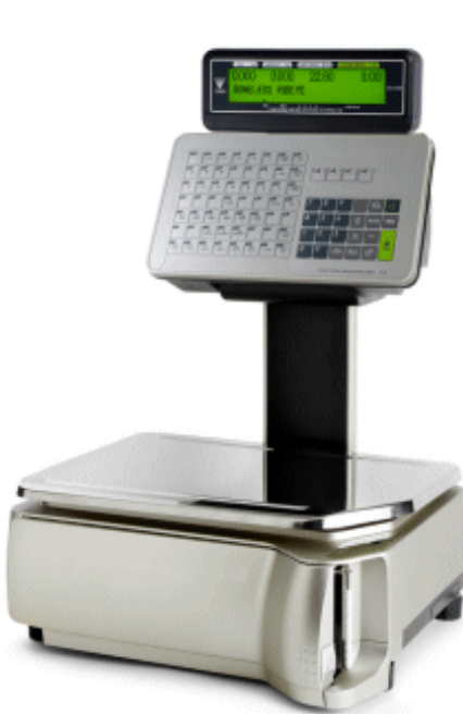
Typical model SM-5400EV / Modèle SM-5400EV typique