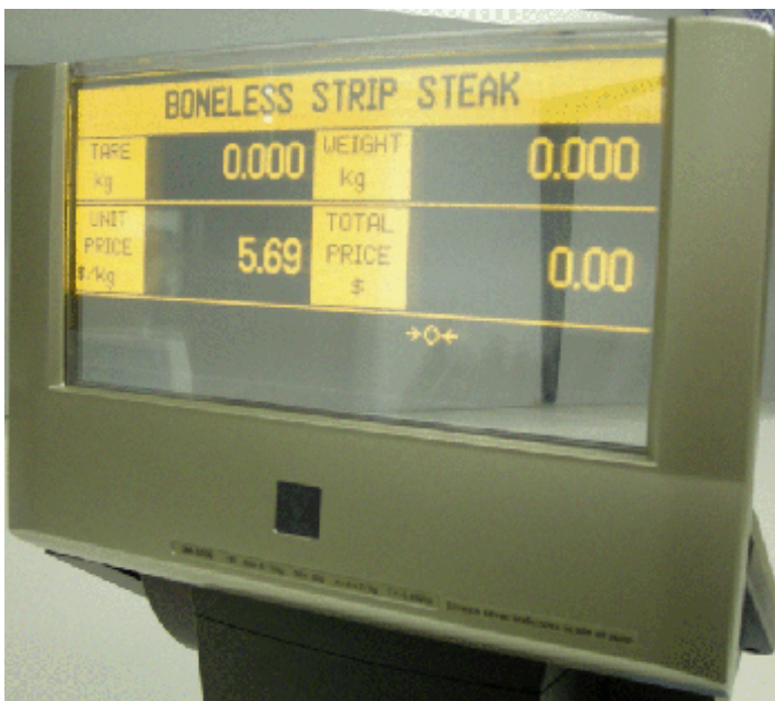
Typical customers' display of models SM-5500P EL and SM-5500EV EL / Affichage destiné aux clients typique des modèles SM-5500P EL et SM-5500EV EL