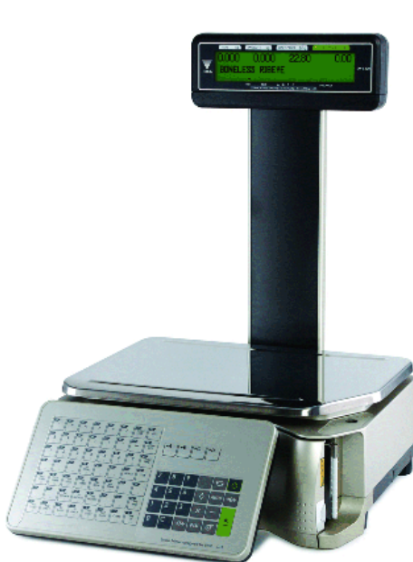
Typical model SM-5400P / Modèle SM-5400P typique