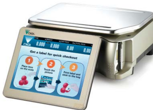
Typical model SM-5500BS / Modèle SM-5500BS typique