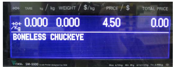
Typical customers' display for SM-5500 series models / Affichage destiné aux clients typique des modèles de la série SM-5500