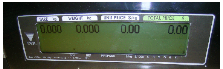
Typical customers' display for SM-5400 series models and SM-5000H / Affichage destiné aux clients typique des modèles de la série SM-5400 et SM-5000H