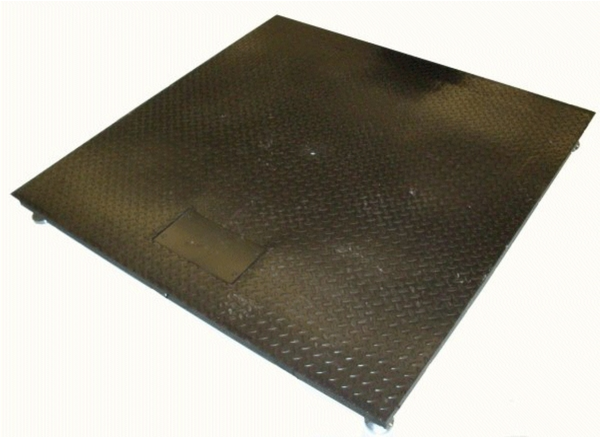
Typical model / Modèle typique