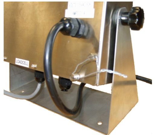
Typical seal for ISI-799 model / Sceau typique pour le modèle ISI-799