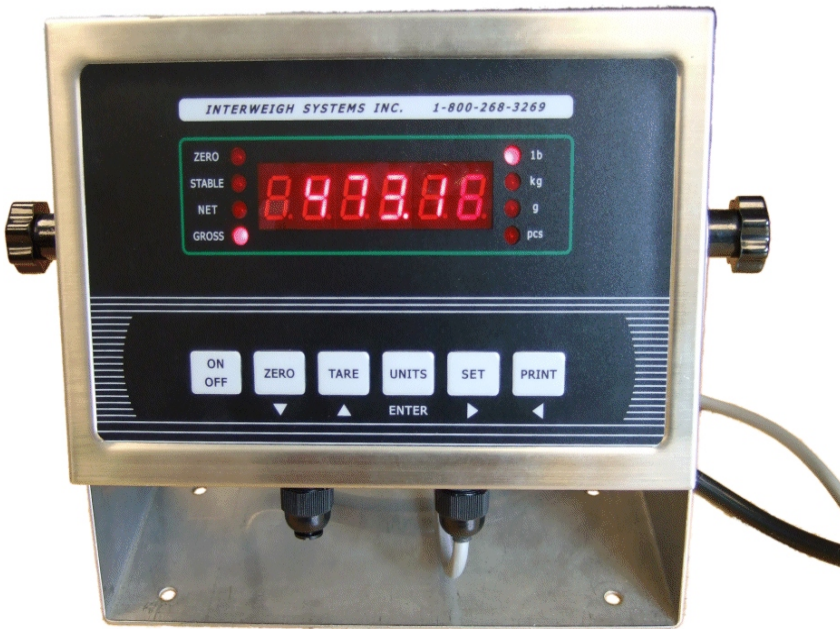
Typical ISI-799 model / Modèle ISI-799 typique