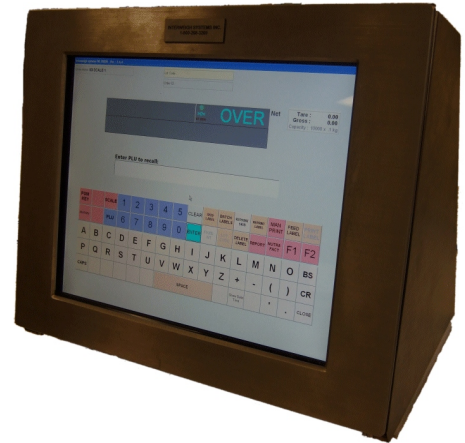
Typical WL-7000S model / Modèle WL-7000S typique