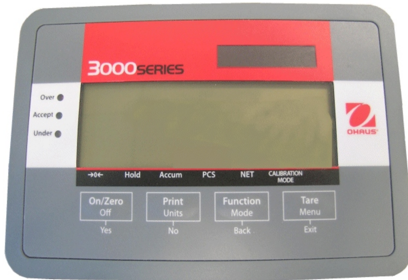
Typical model T32MC / Modèle typique T32MC