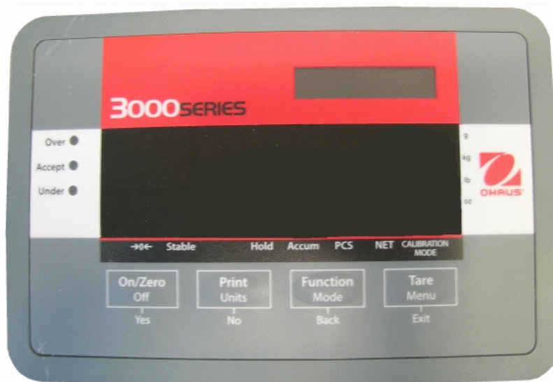
Typical model T32ME / Modèle typique T32ME