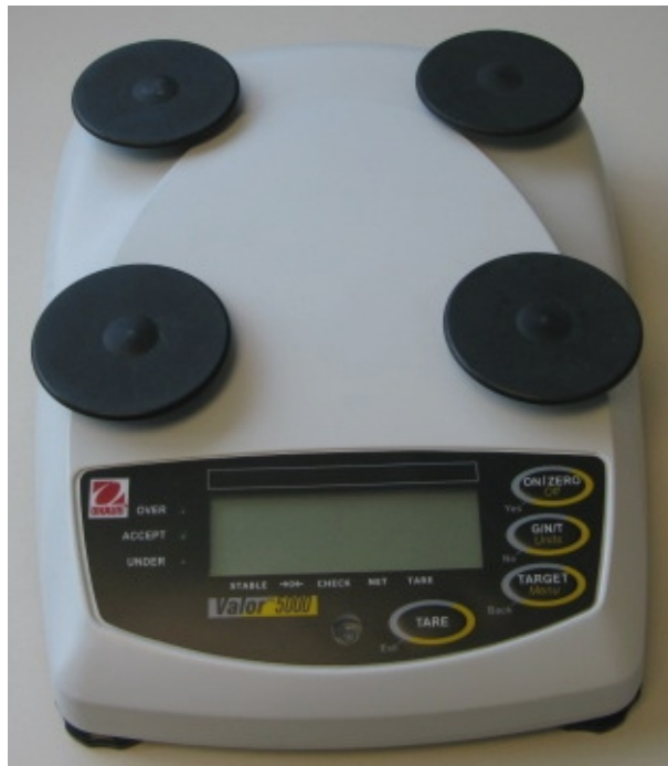
Typical V51P* sub-platter / Sous-plateau typique des modèles V51P*