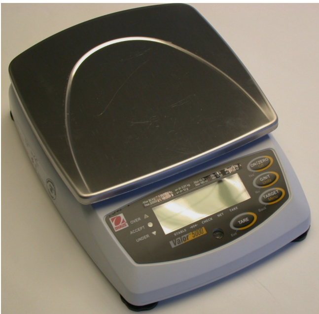
Typical model V51P* / modèle V51P* typique