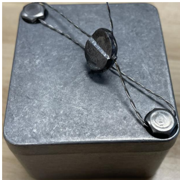
Typical jumper box sealing ZX10 / Scellement typique d'une boîte à cavaliers ZX10