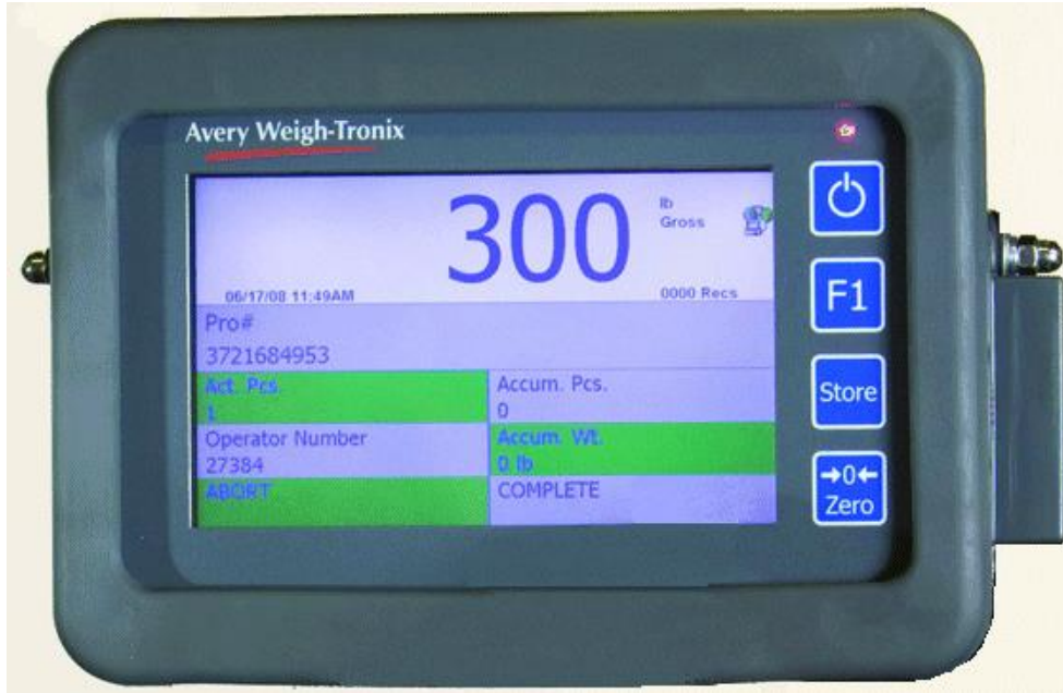
Typical model FLI-425 / Modèle typique FLI-425