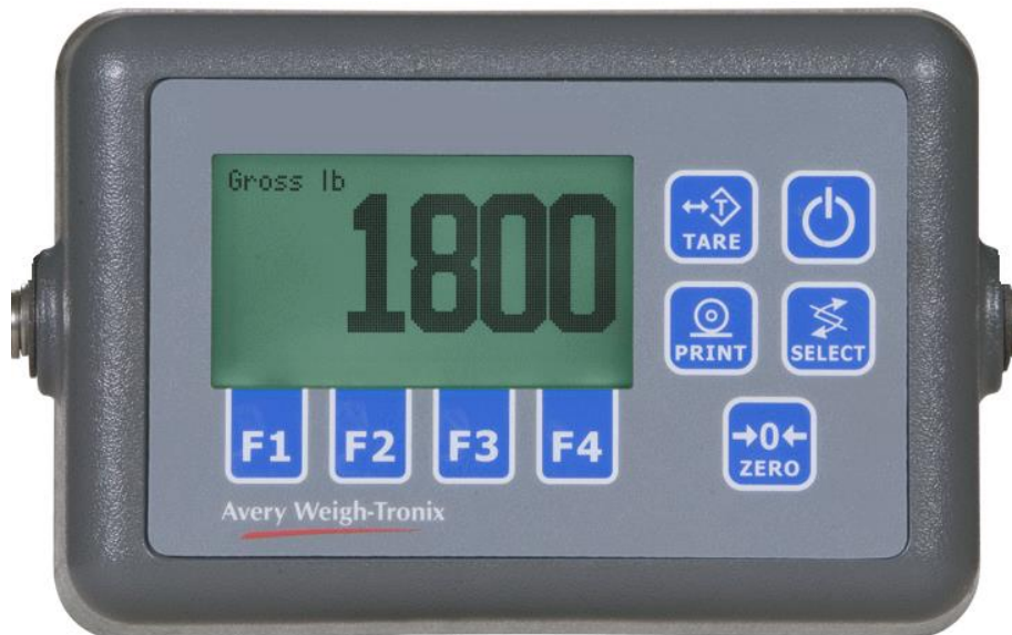
Typical model FLI-225 / Modèle typique FLI-225