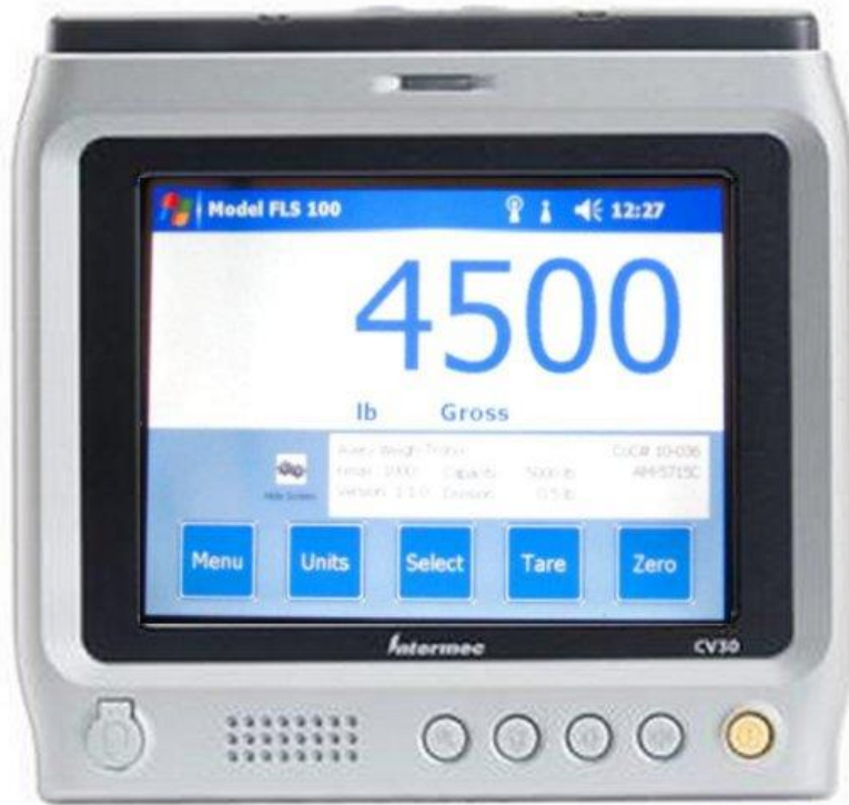
Typical model CV30 / Modèle typique CV30