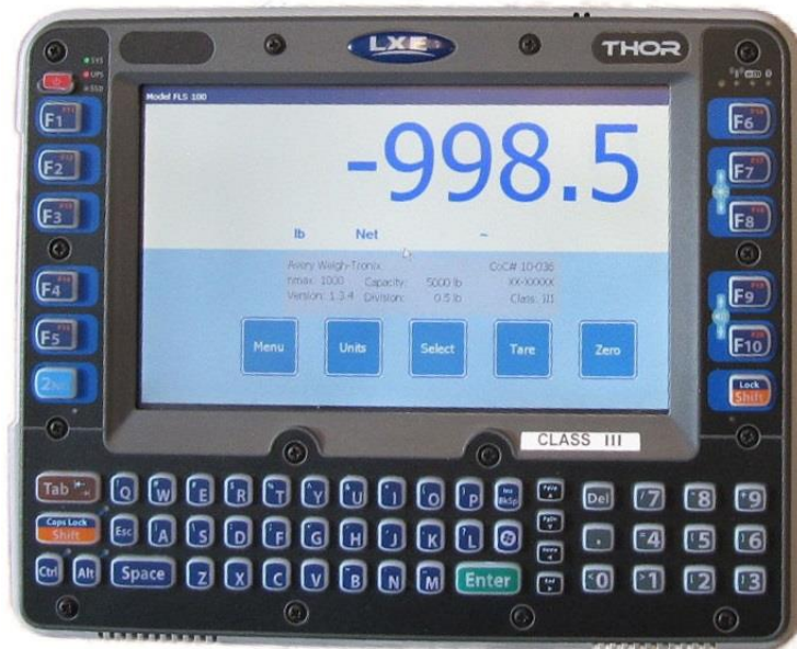
Typical model THOR / Modèle typique THOR