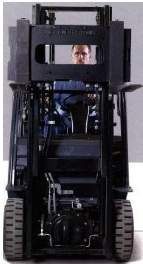
Typical FLSC-05 installation / Installation typique FLSC-05