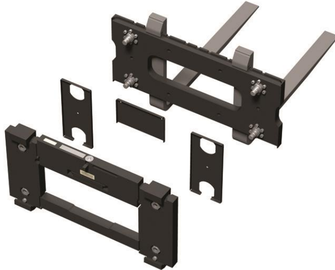
Typical FLSC-05 carriage assembly / Attelage assemblé FLSC-05 typique