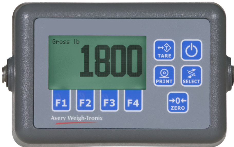
Typical model FLI-225 / Modèle typique FLI-225