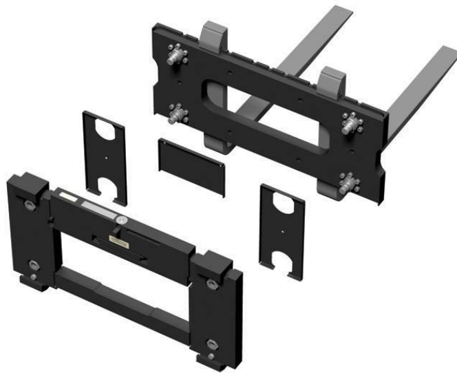
Typical FLSC-05 carriage assembly / Attelage assemblé FLSC-05 typique