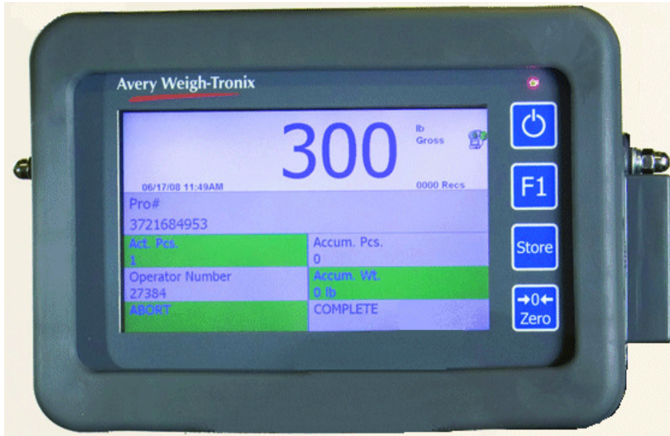
Typical model FLI-425 / Modèle typique FLI-425