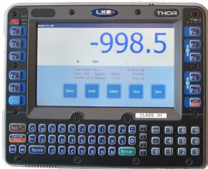
Typical model THOR / Modèle typique THOR