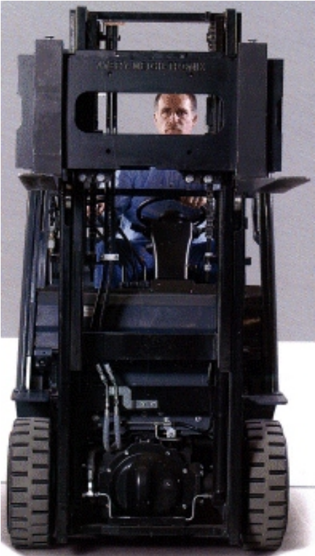
Typical FLSC-05 installation / Installation typique FLSC-05