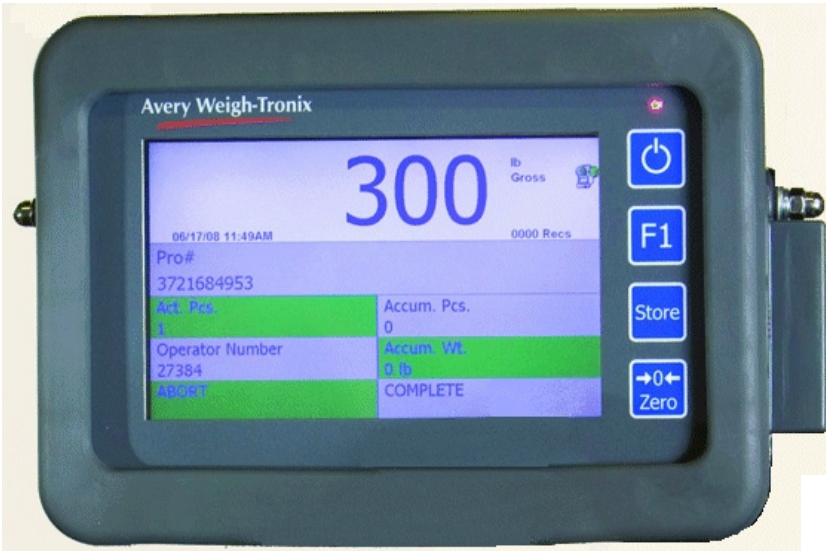
Typical models FLI-425 / Modèle typique FLI-425