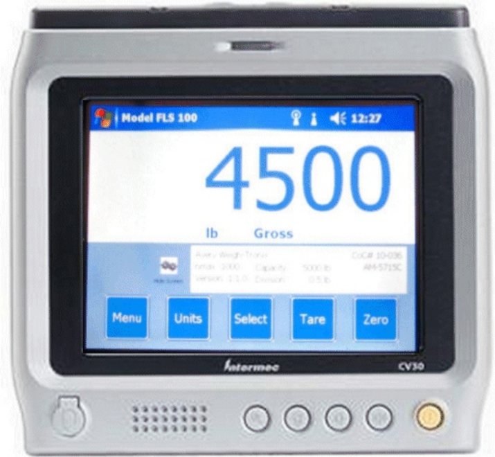
Typical model CV30 / Modèle typique CV30