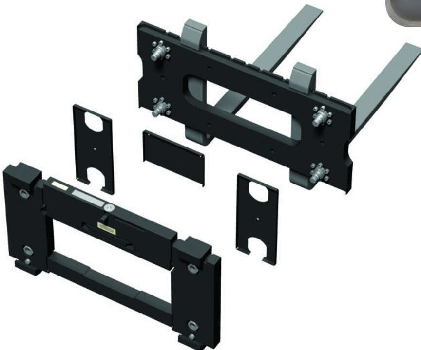
Typical FLSC-05 Carriage assembly / Attelage assemblé FLSC-05 typique