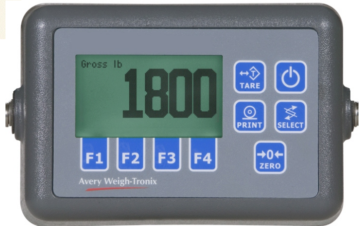
Typical models FLI-225 / Modèle typique FLI-225