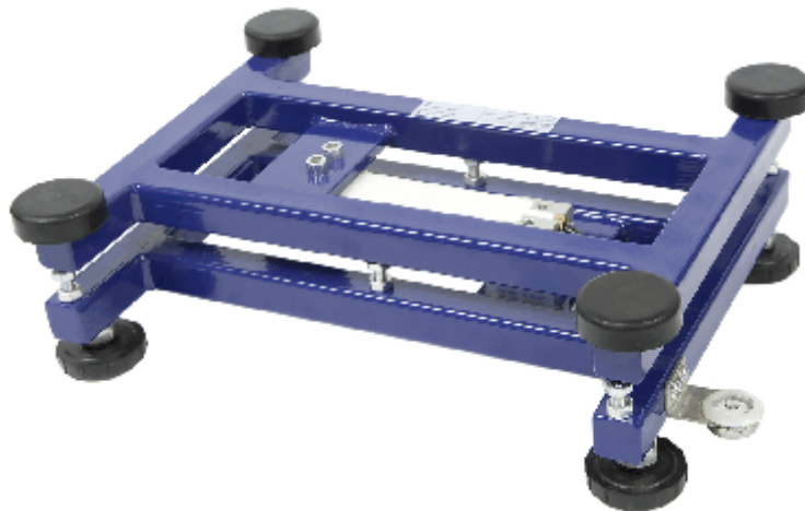
Typical model PBA210-yyzzzB (without platter) / Modèle typique PBA210-yyzzzB (sans plateau)