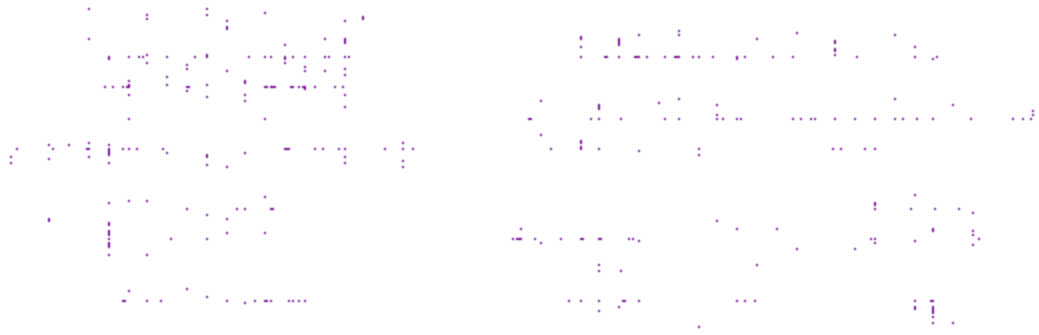
Typical data label / étiquette de données typique