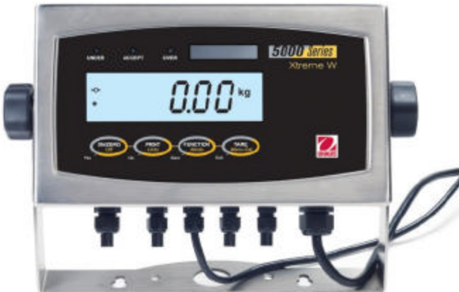
Typical model T51P / modèle T51P typique