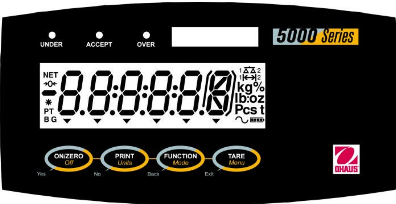
Typical T51P or T51XW keypad and display / Touches et affichage typiques des modèles T51P et T51XW