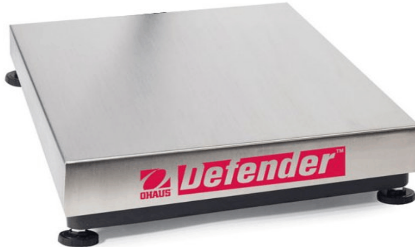
Typical Model Dnnnyz / Modèle typique Dnnnyz