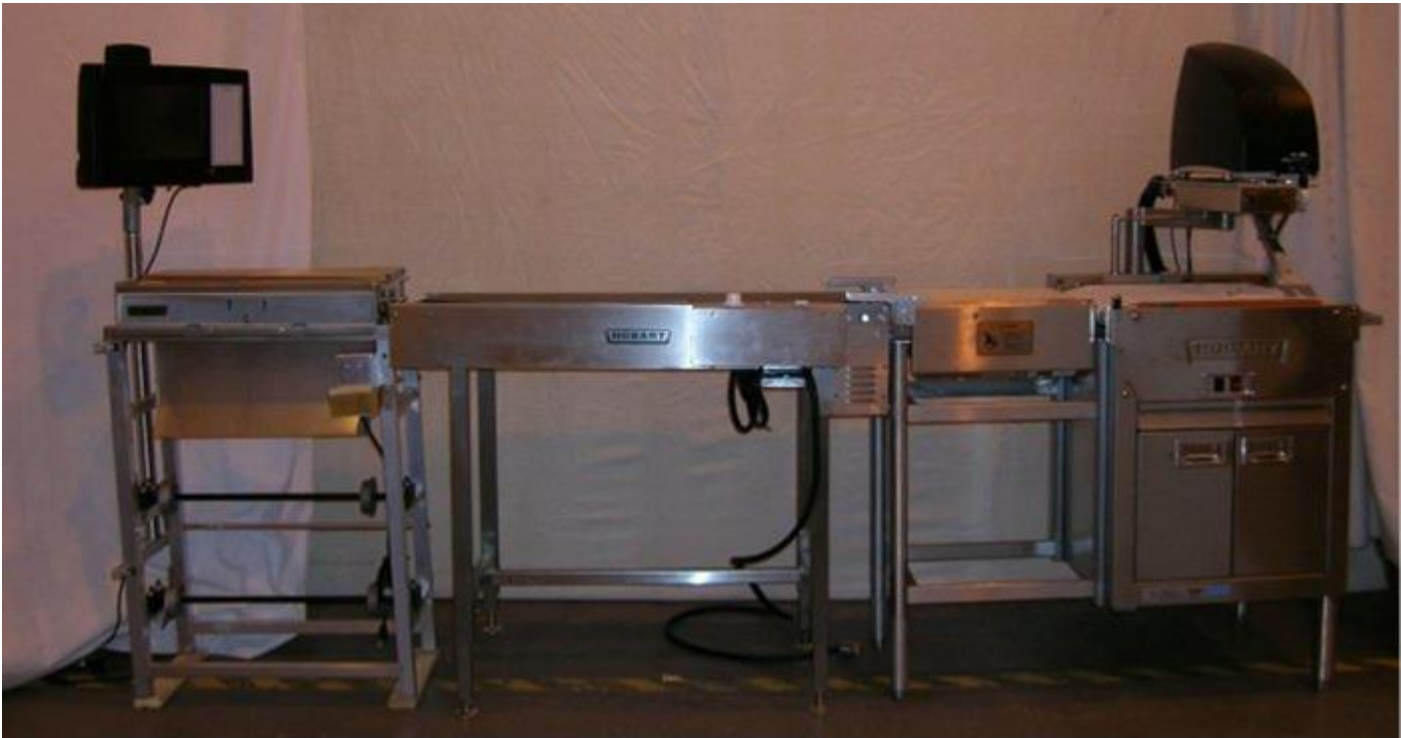
Typical Model EPSA-C + EPCP-# or CLAS-* + EPCP-# / Modèle EPSA-C + EPCP-# or CLAS-* + EPCP-# typique PARTIE 9 - Évalué par