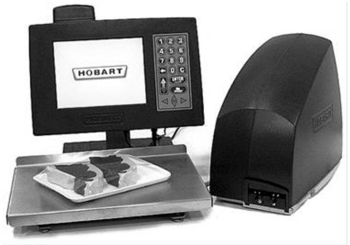
Typical Model EPSA-1 + EPCP-# or EPSA-2 + EPCP-# / Modèle typique EPSA-1 + EPCP-# ou EPSA-2 + EPCP-#