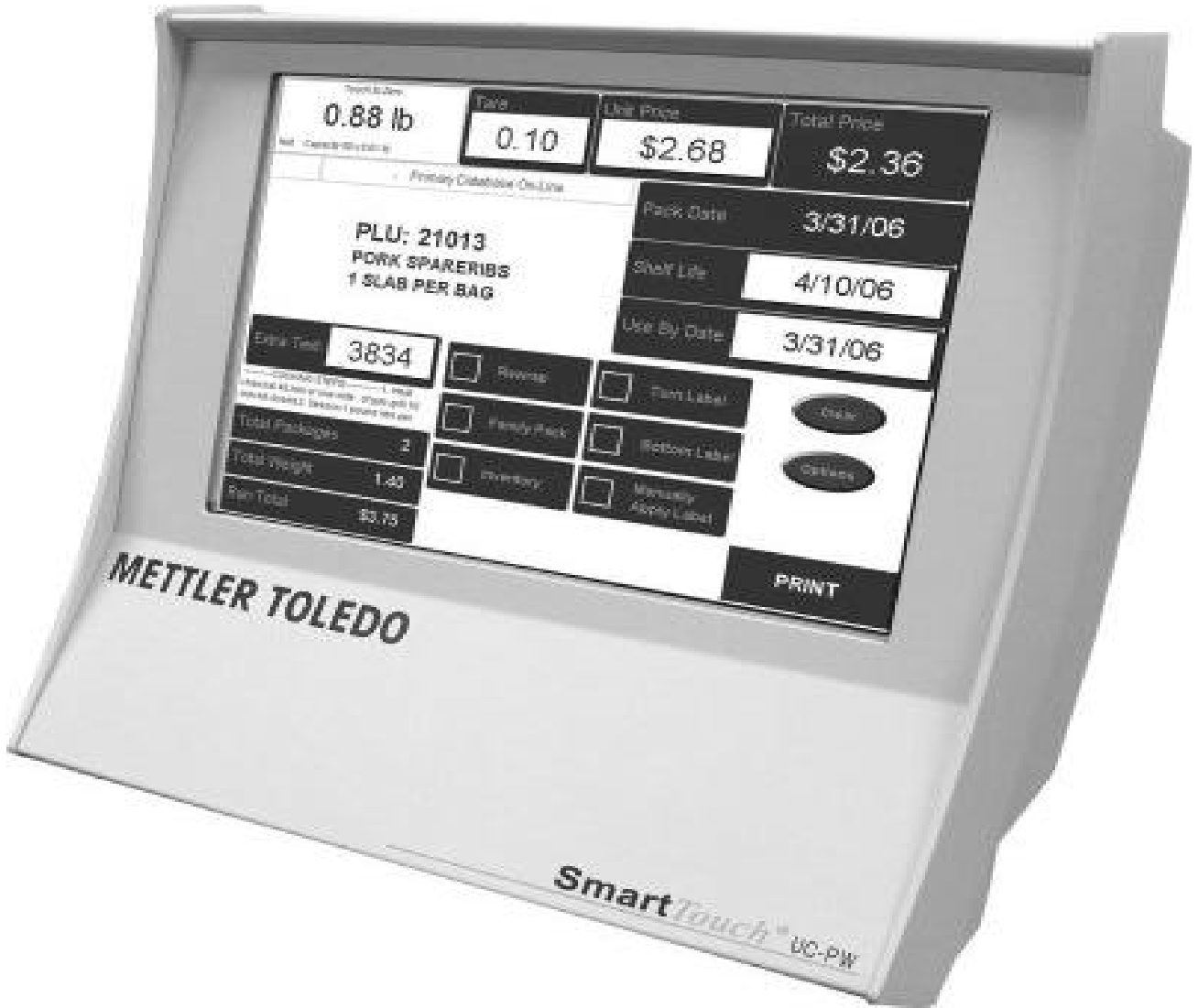
Indicator for model 0648/ Indicateur pour modèle 0648