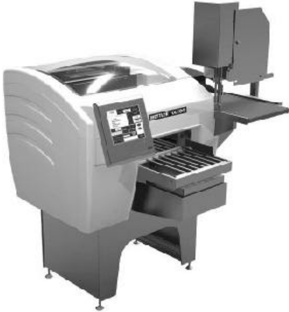
Model 0648/ modèle 0648