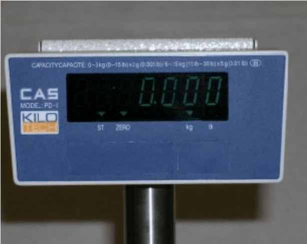
Column mounted / Affichage monté sur colonne