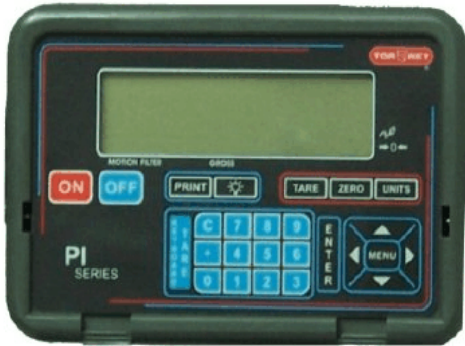
Typical Model PI / Modèle typique PI