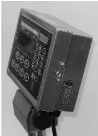
Wire sealing/ Scellé avec fil