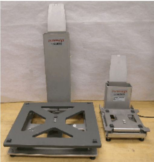
Typical Duraweigh Models (no platter) / Modèles Duraweigh typiques (sans plateau)