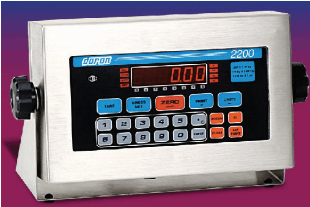
Typical Model 2200 / Modèle typique 2200