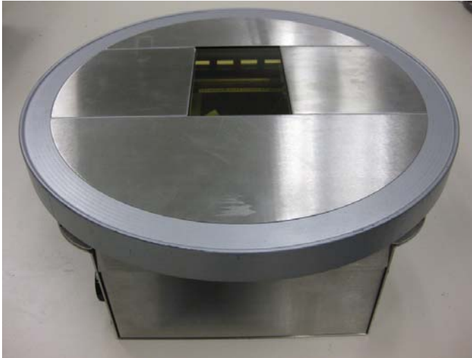
Typical model 7812-5*** (circular platter) / Modèle typique 7812-5*** (plateau circulaire)