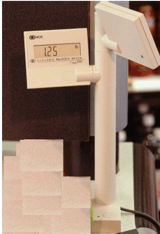
Typical remote column display model 7825 / Dispositif indicateur à distance monté sur colonne modèle typique 7825