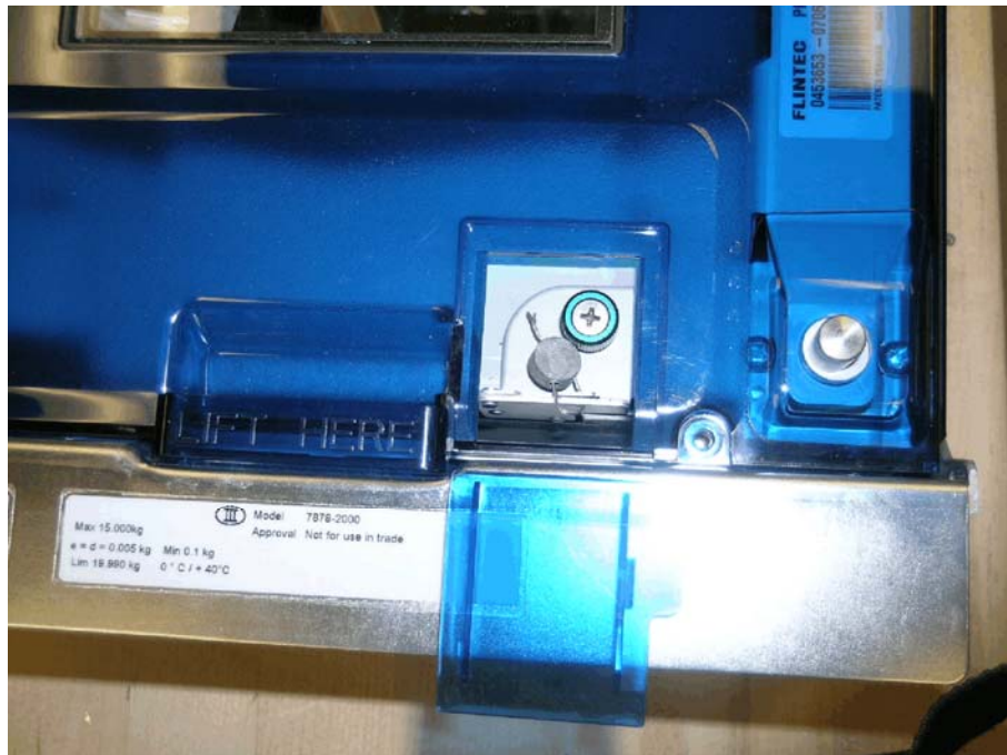
Typical sealing method / Méthode de scellage typique