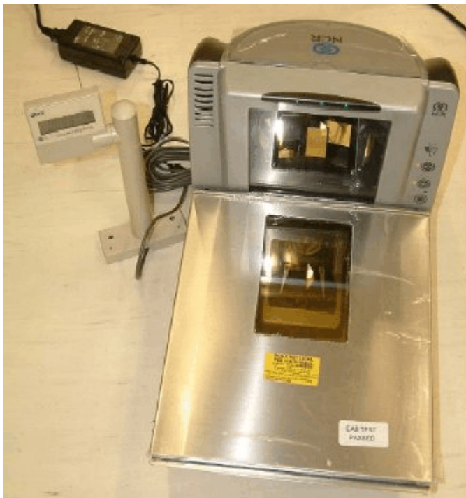
Typical model 7878-2*** / Modèle typique 7878-2***