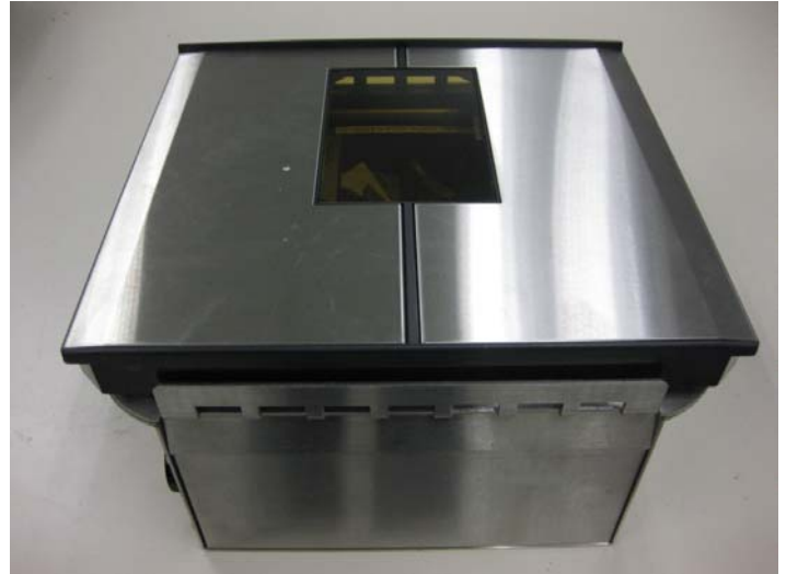
Typical model 7812-5*** (rectangular platter) / Modèle typique 7812-5*** (plateau rectangulaire)