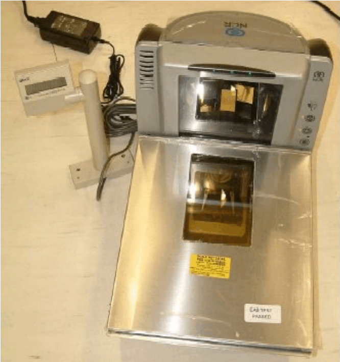
Typical model 7878-2***/ Modèle typique 7878-2***