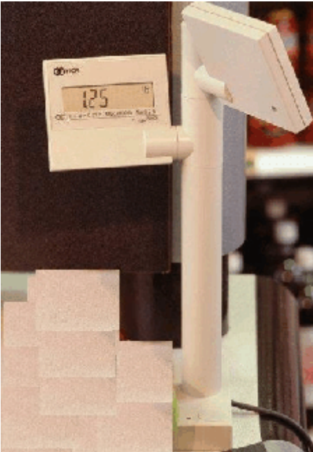
Typical remote column mounted display model 7825 / Dispositif indicateur à distance monté sur colonne modèle 7825