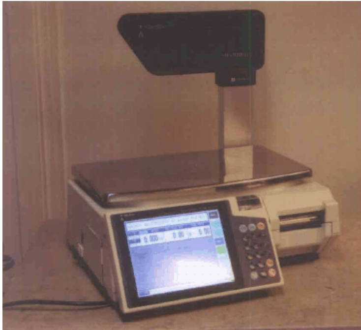
Typical model SR-2000α with pole mounted customer display / Modèle SR-2000α typique avec affichage monté sur colonne destiné aux clients