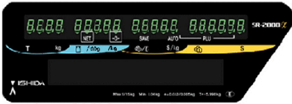
Typical pole mounted customer's display / Affichage monté sur colonne typique destiné aux clients