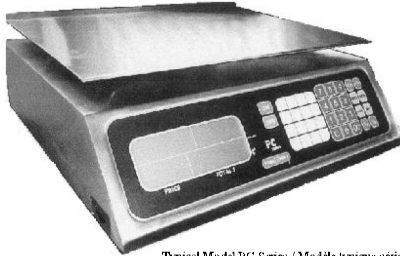
Typical Model PC Series / Modèle typique série PC