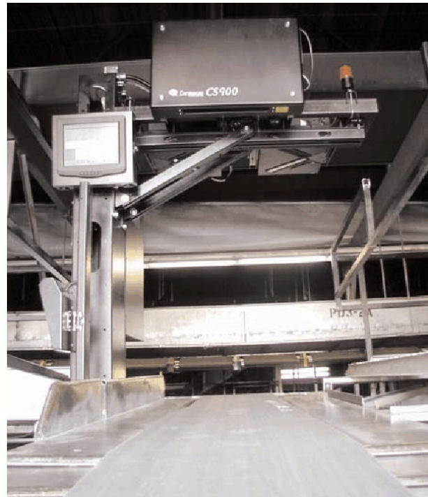
Typical Model CS900, CSN910 or CND910 / Modèle CS900, CSN910 ou CND910 typique