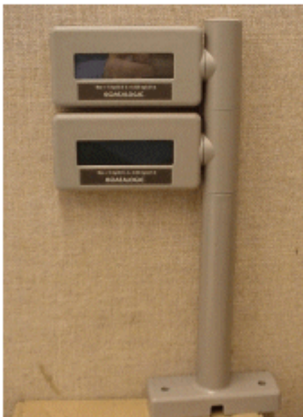
8300RD dual display / Affichage double 8300RD