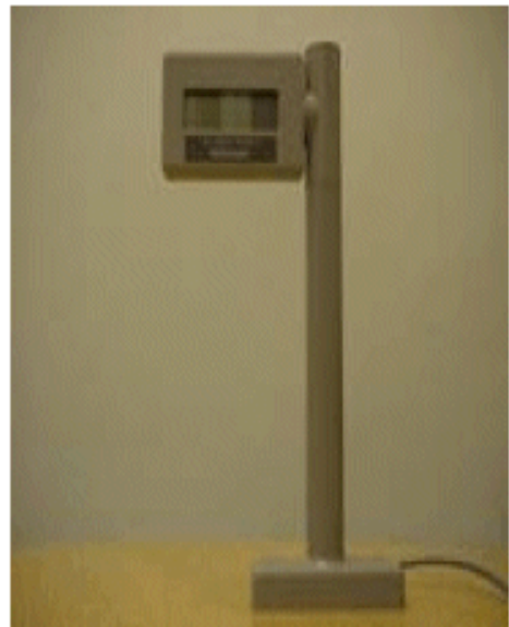
8300RD single display / Affichage simple 8300RD