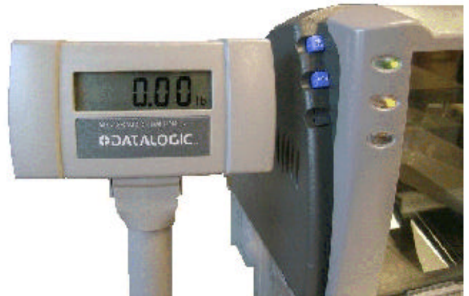
Typical 960RD remote display and operator controls / Affichage à distance 960RD et boutons de contrôle typiques