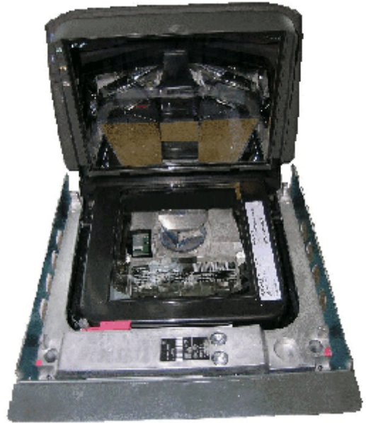
Sub-platter / Sous-plateau