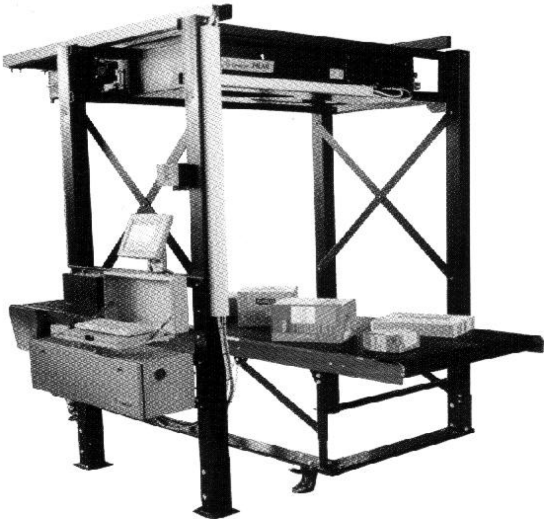
Typical model / modèle typique

La révision 4 vise à modifier les TERMES ET CONDITIONS.