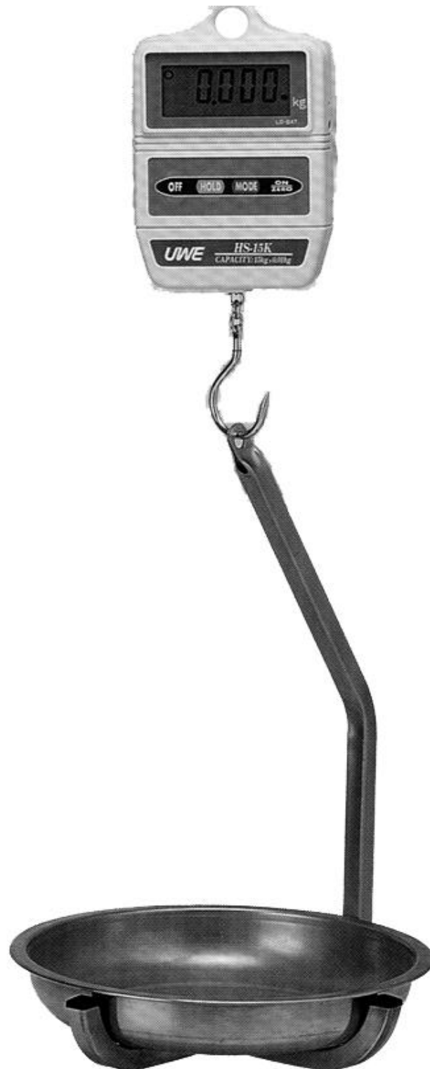
Model / Modèle HS-15 With a typical hanging platter / avec un plateau suspendu typique