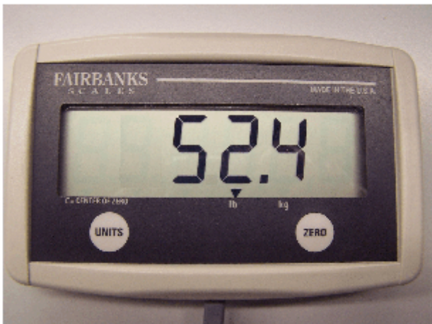
Typical remote display / Affichage à distance typique