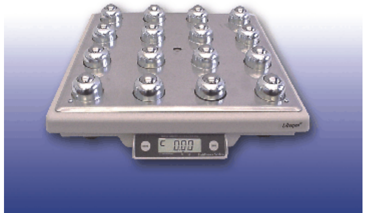
Typical model SCB-R9000-*** with optional roller ball platter. / Modèle typique SCB-R9000-*** avec, en option, un plateau à billes