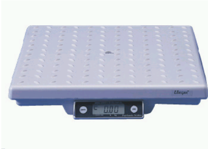
Typical Model SCB-R9000-*** / Modèle typique SCB-R9000-***