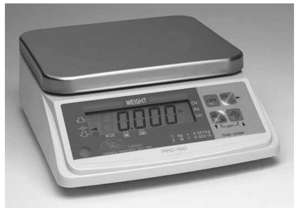
Typical Model / Modèle typique