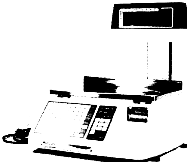
MODEL / modèle SL9000