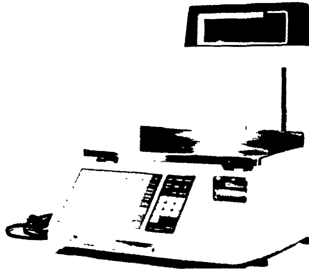
MODEL / modèle SL9000