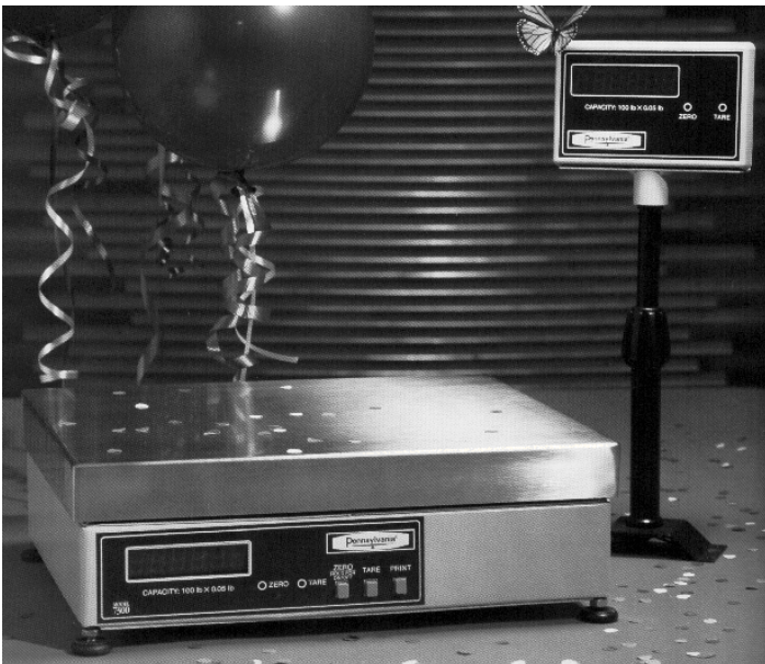
Scale With Remote Display 7300 Balance 7300 et dispositif d'affichage à distance