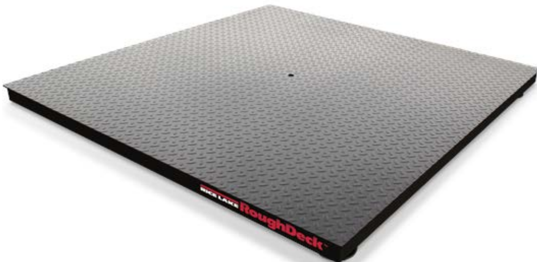
Typical mild steel device / Appareil en acier doux typique