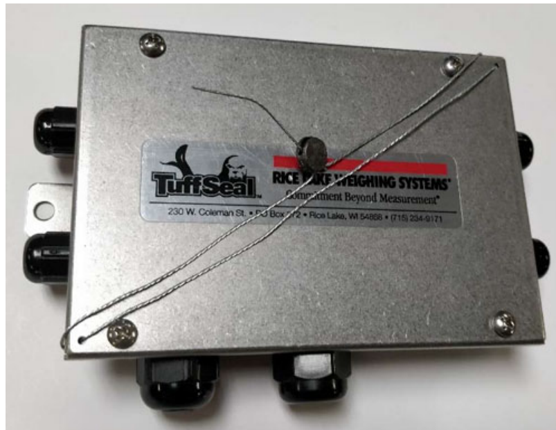
Typical external junction box sealing / Scellage pour la boîte de jonction externe typique