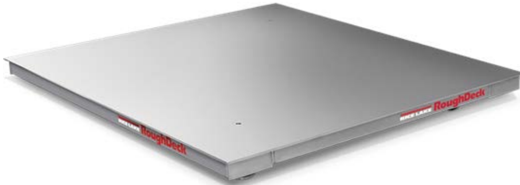
Typical stainless steel device / Appareil en acier inoxydable typique