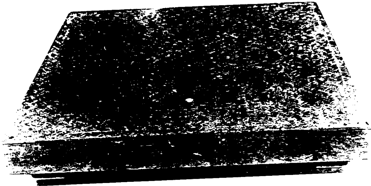
TYPICAL MODEL / modèle type