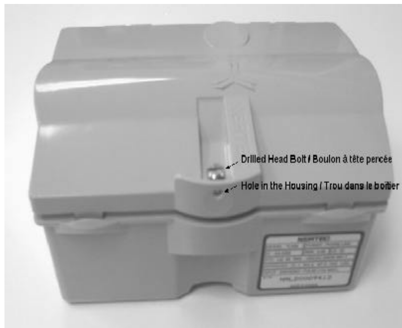
Sealing arrangement for the new housing / Mode de scellage du nouveau boîtier