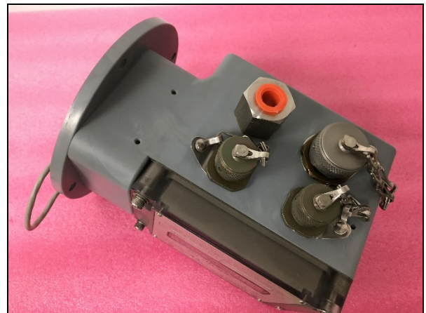
Figure 4: AdEM-PTZ with two Cannon Outputs and Customer Display Reed Switch (hidden in lid assembly)/ AdEM-PTZ avec deux sorties de type Cannon, et l'affichage du client (commutateur cache sur le boîtier de montage)