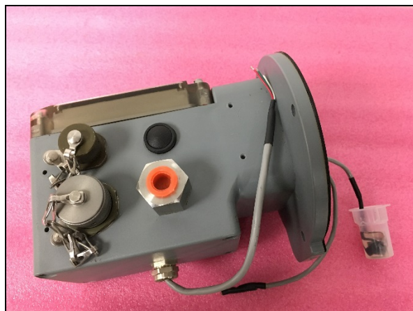
Figure 3: AdEM-PTZ with Cannon and PG9 Pigtail Outputs AdEM-PTZ avec sorties de type Cannon et PG9