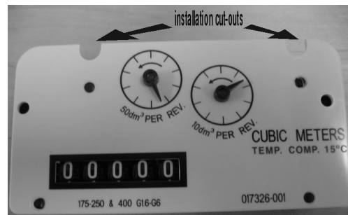
Replacement Index Front / Avant d'Indicateur Remplacement