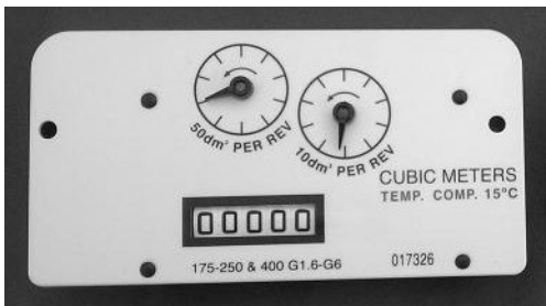
Current Index Front / Avant d'Indicateur Actuel