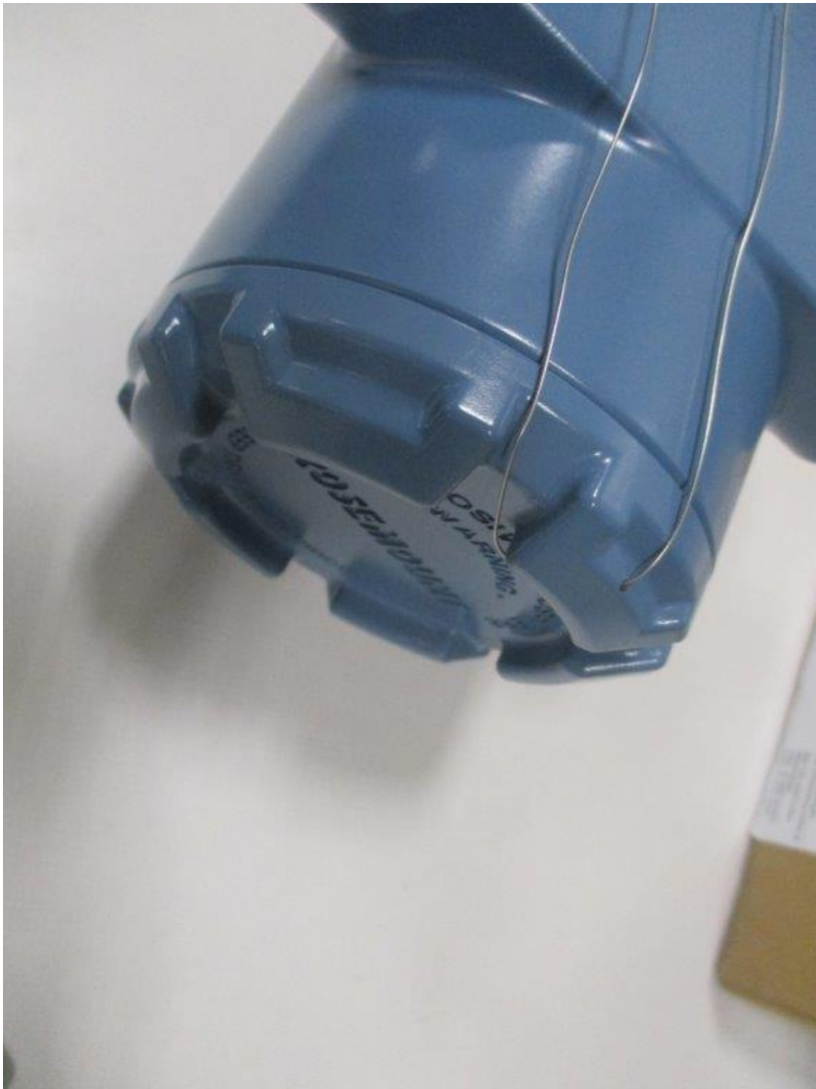
Figure 3: Sealing of housing / Scellage du boîtier