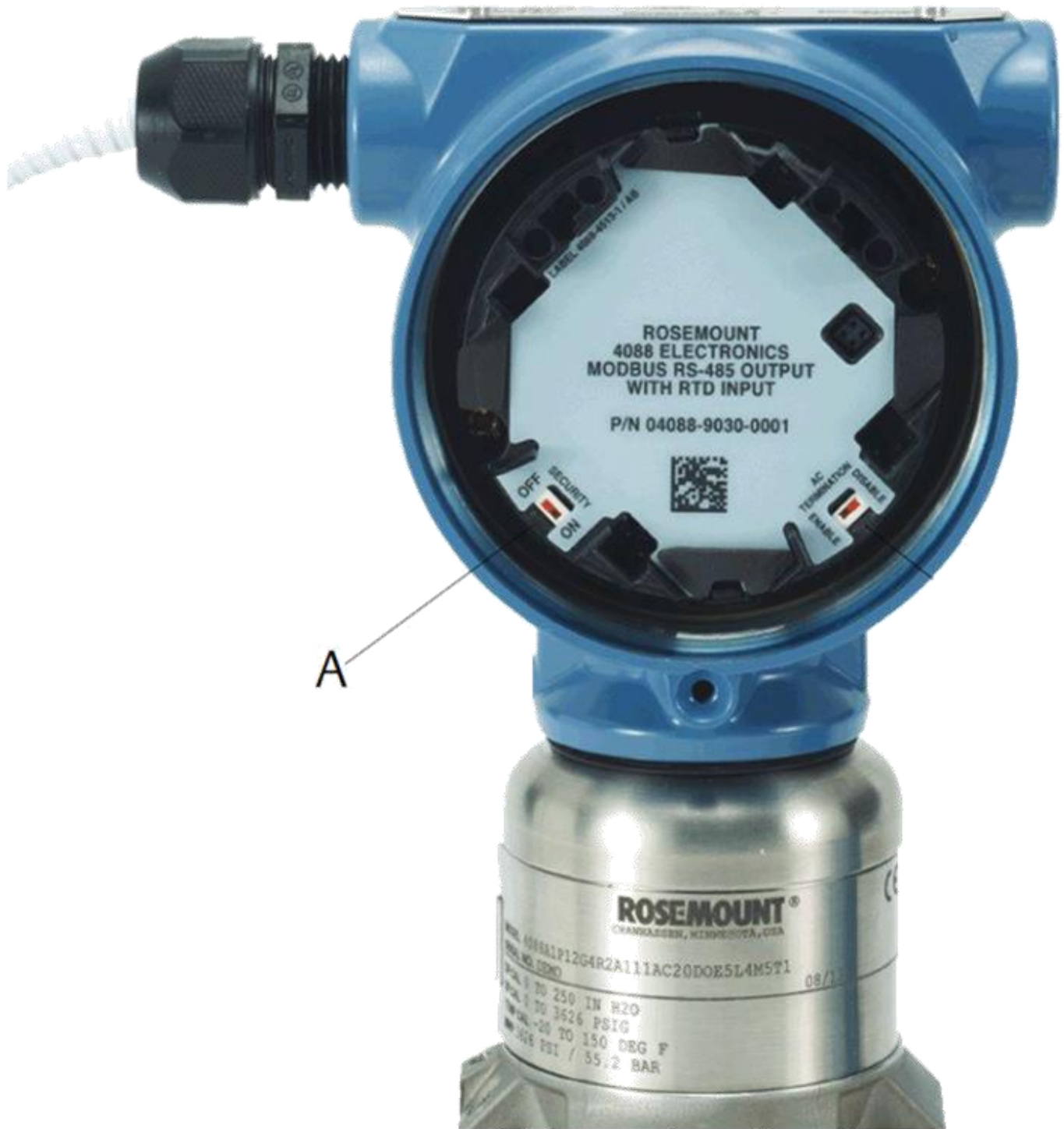
Figure 2: Security switch identified by “A”/ Interrupteur de sécurité identifié par "A".