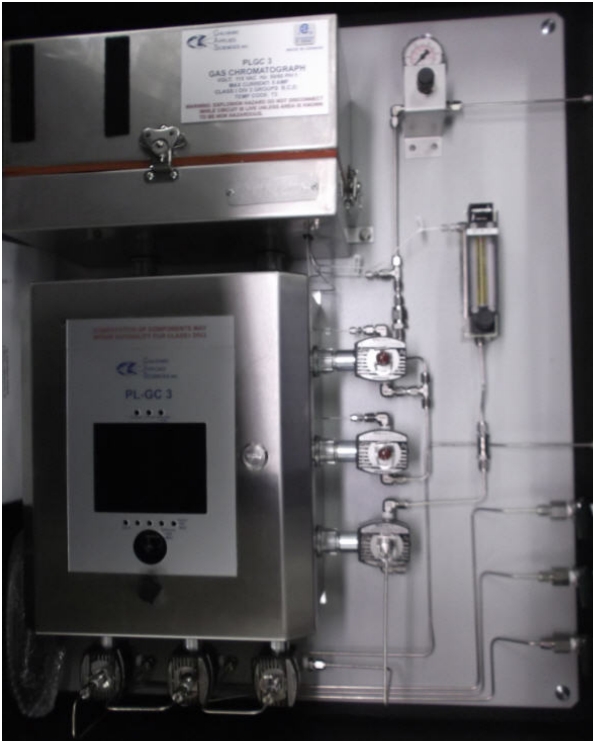
Figure 2. Sample photograph of the AccuChrome with the Class 1, Div. 2 enclosure for the controller \ Photographie de l'AccuChrome avec un boîtier de commande de classe 1, division 2