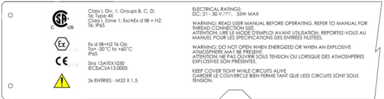
Figure 3. Magnification of the Left Side of the Sample Nameplate / Grossissement du côté gauche du modèle de plaque signalétique