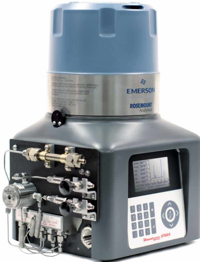
Figure 1. 370XA