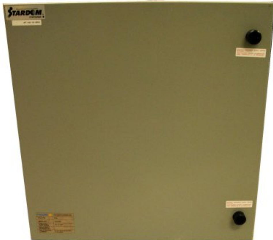
Figure 1. FCN Enclosure / Boîtier FCN