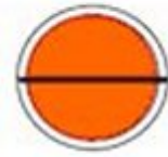
Figure 3. Padlockable Quarter-turn Latch and the Sealing Arrangement / Dispositif de scellage verrouillable par un loquet quart de tour à cadenas