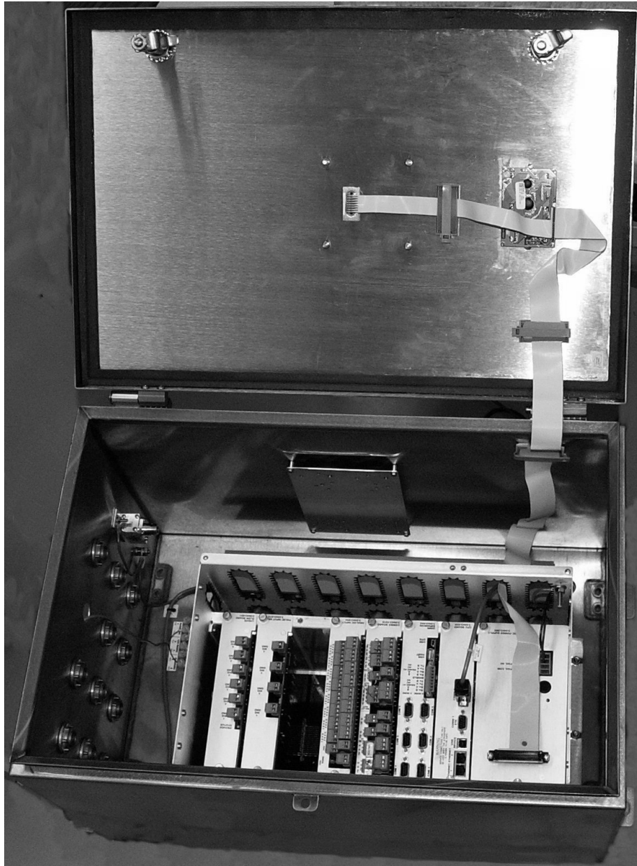
Fig. 2: AutoEXEC (internal view) / (vue de l'intérieur)