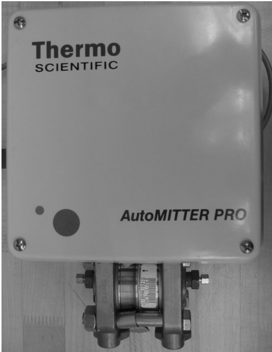
Fig. 4: AutoMITTER PRO