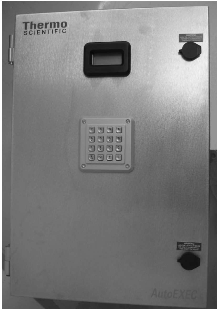
Fig. 1 : AutoEXEC enclosure door / Porte du boîtier de l'AutoEXEC